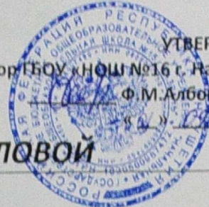
ГРАФИК ПОСЕЩЕНИЙ СТОЛОВОЙ